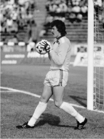
Souveräne Strafraumbherrschaft, sicheres Stellungsspiel, große Fangsicherheit und unglaubliche Reflexe waren seine Stärken

Die „Fußball-Weltzeitschrift“ aus Wiesbaden schreibt in ihrer Ausgabe vom Sept./Okt. 1987 in einem Steckbrief: „Der Banater Schwabe mit den Gardemaßen (1,88 m, 88 kg), Helmut Duckadam, begann auf der Dorfwiese in Semlak Fußball zu spielen. 16jährig zog es ihn in die benachbarte Kreisstadt Arad und bereits 18jährig schaffte er den Sprung in den erfolgreichsten rumänischen Nachkriegs-